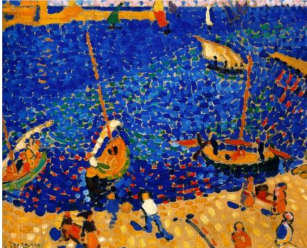
Boats at Collioure