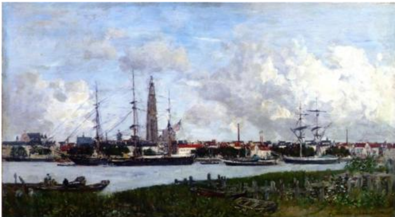
Antwerp, the Port