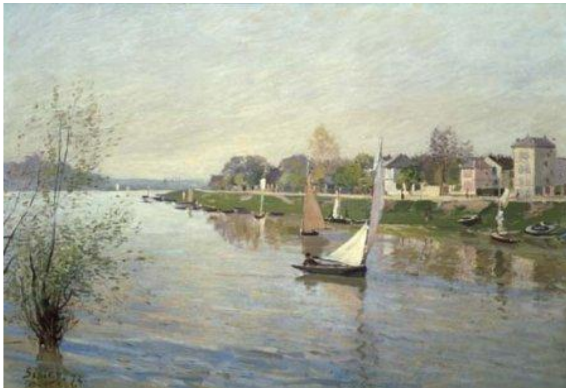
The Seine at Argenteuil