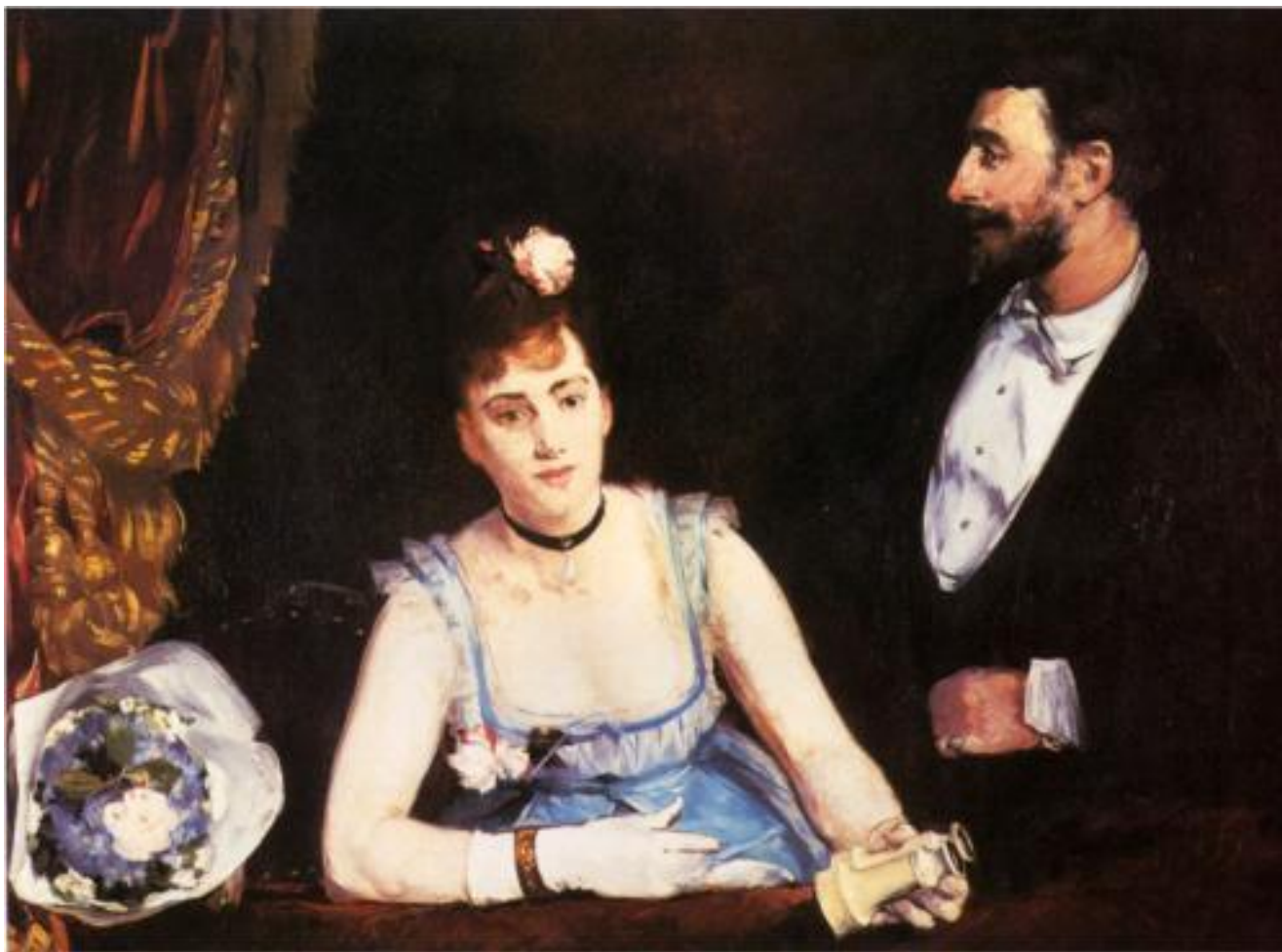
A Box at the Italian Theatre