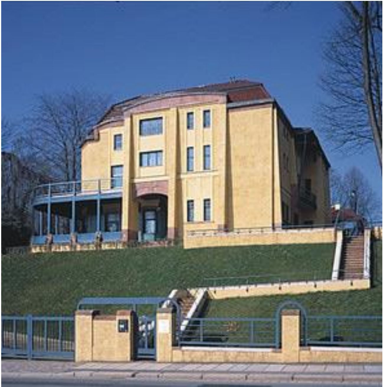
Villa Esche (1902-1903, Chemnitz, Německo)