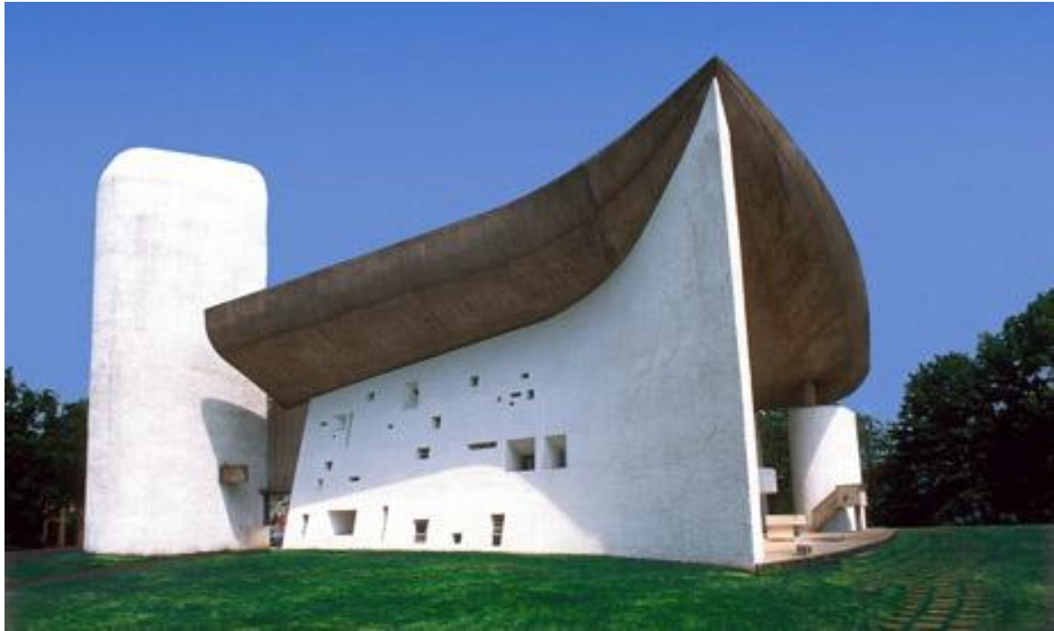
Chapelle Notre Dame du Haut (1950–1954, Ronchamp, France)