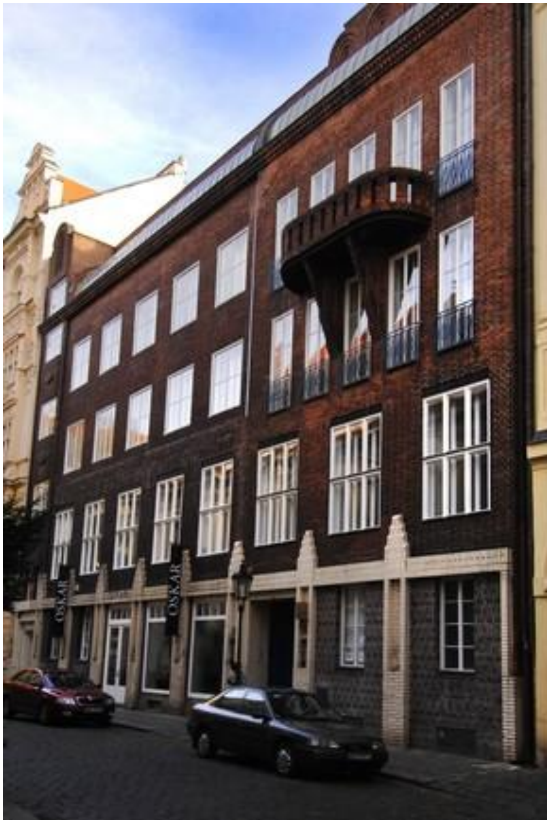
Štencův dům (1908, Praha, Česká republika)