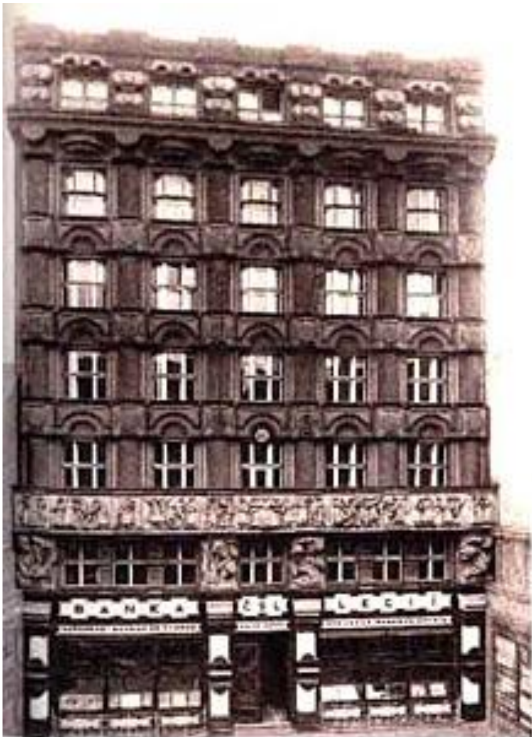
Budova Banky československých legií v Praze, Na Poříčí (dnes ČSOB)