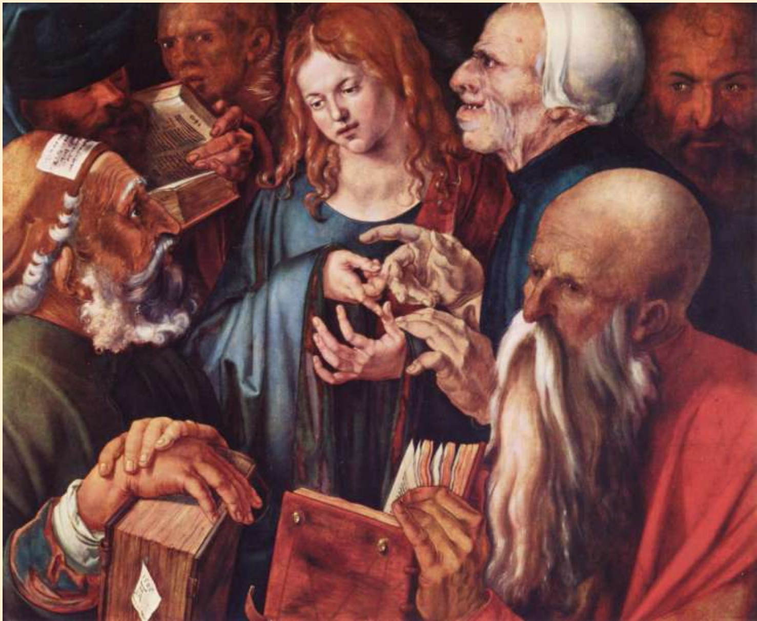
Kristus mezi učenci