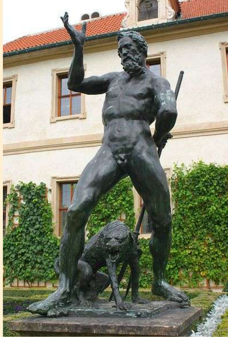
← Appolon ↑ Neptun