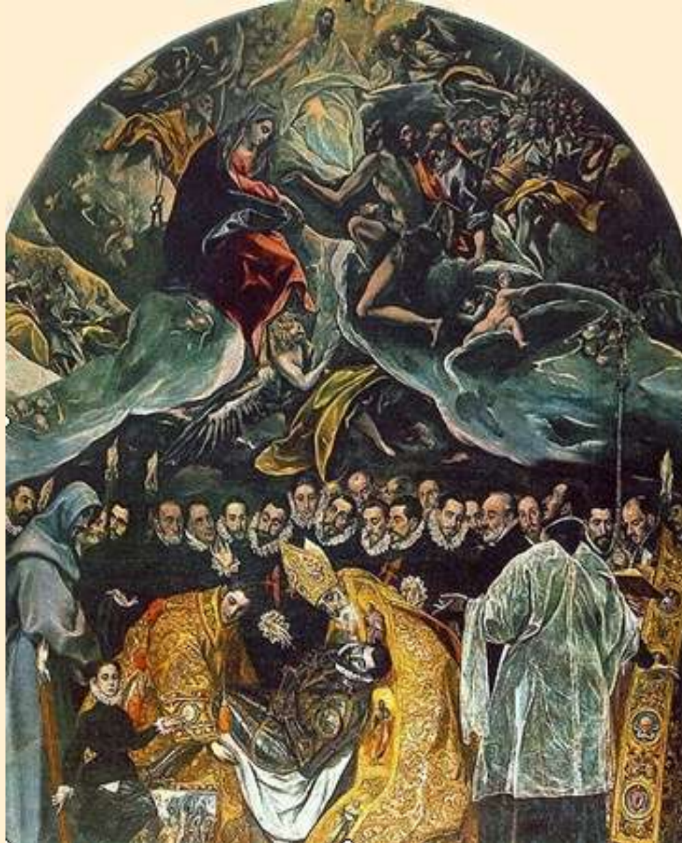
Pohřeb hraběte Orgaze