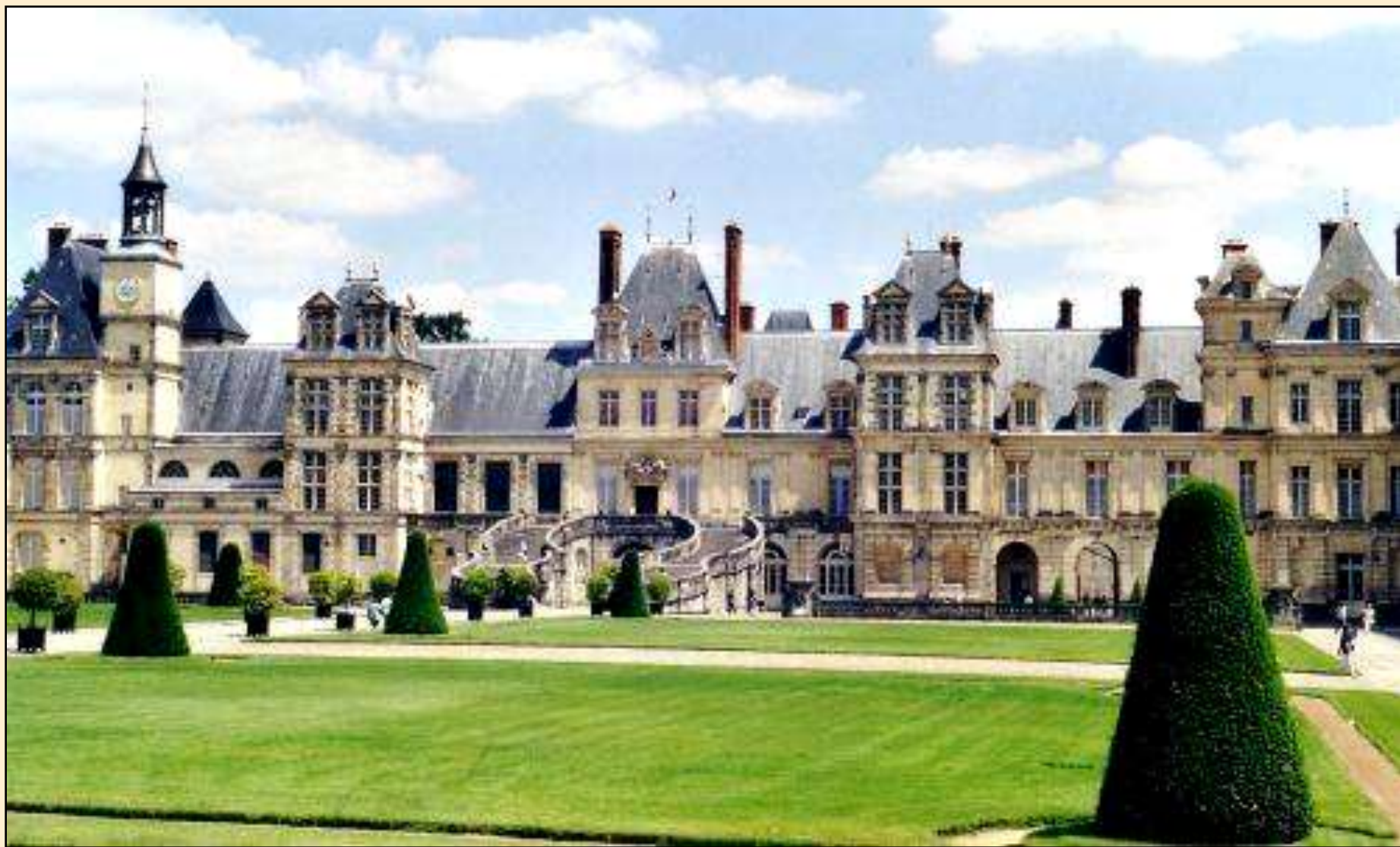
Zámek ve Fontainebleau