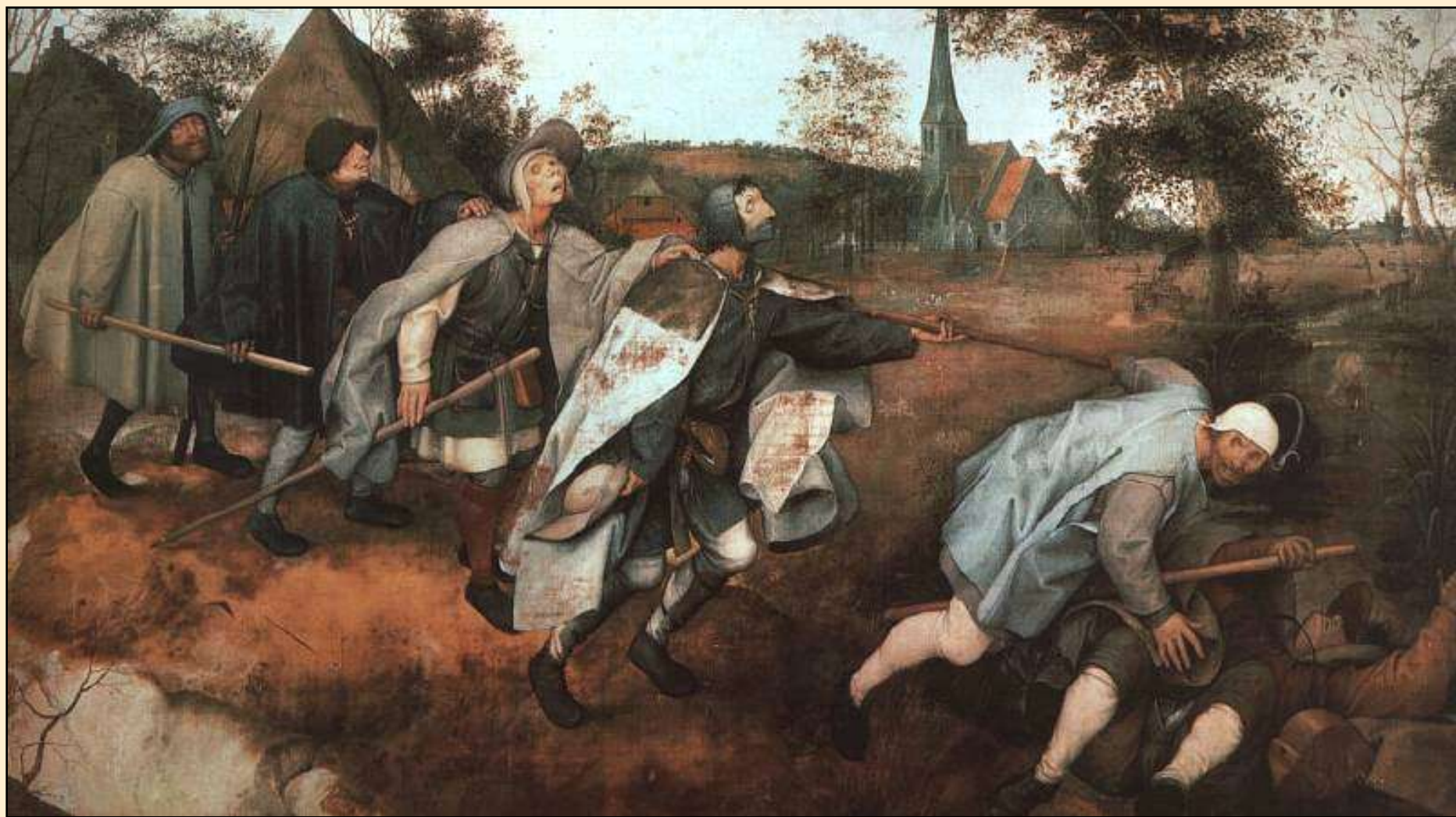
Podobenství o slepcích