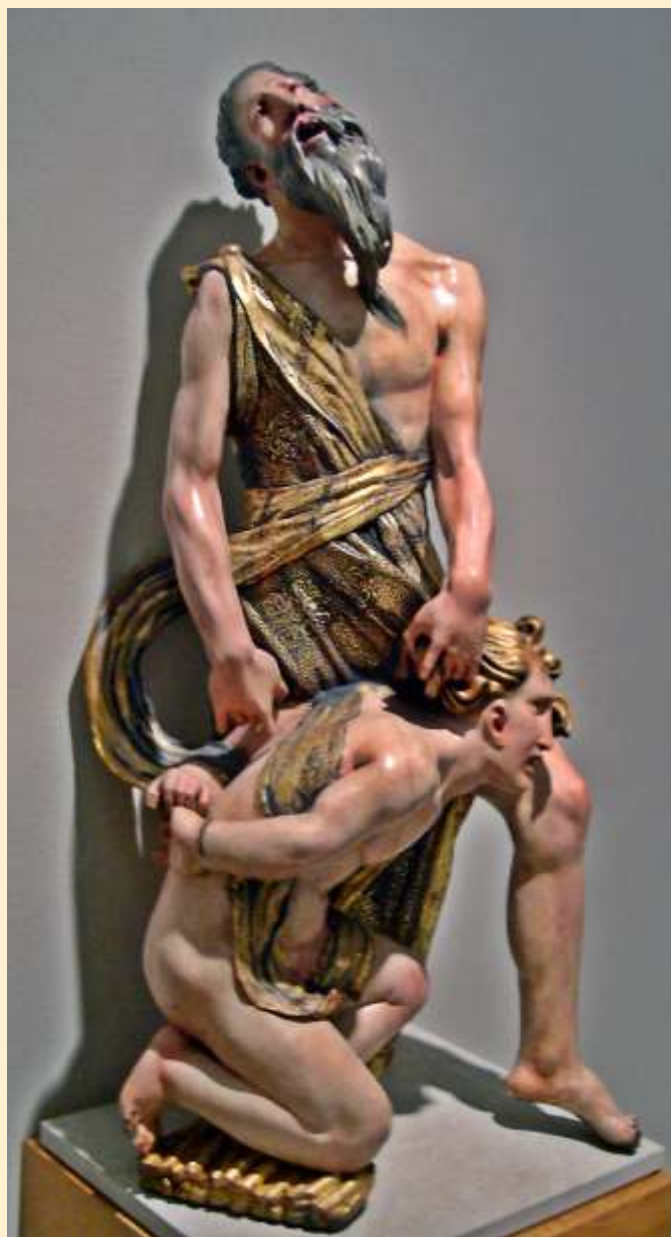
Alonso Berruguete – Obětování Izáka