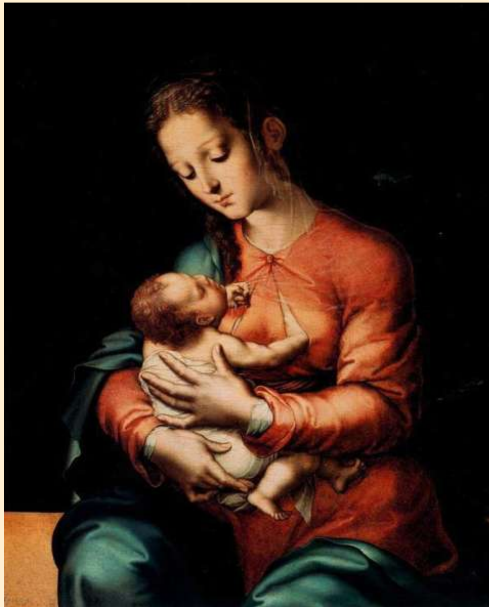
Luis de Morales – Madona s dítětem