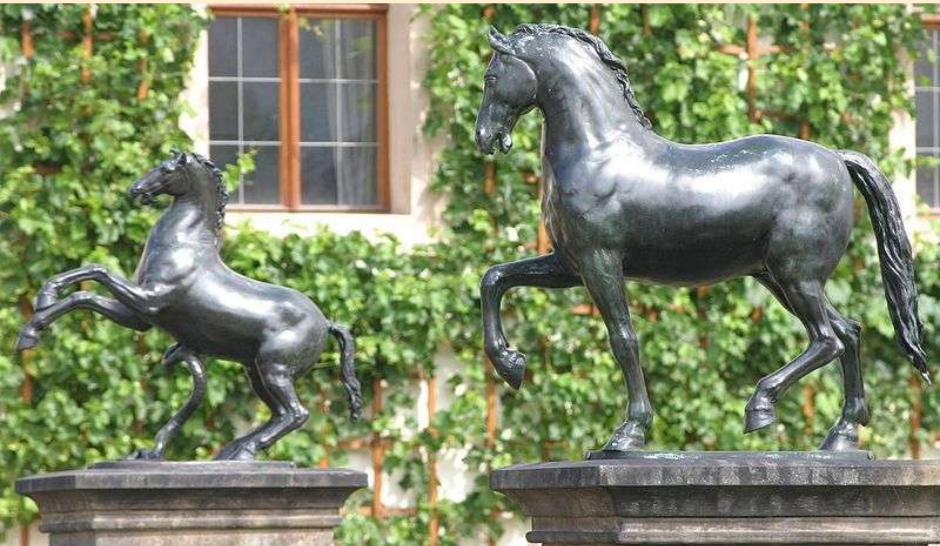
Kůň s hadem