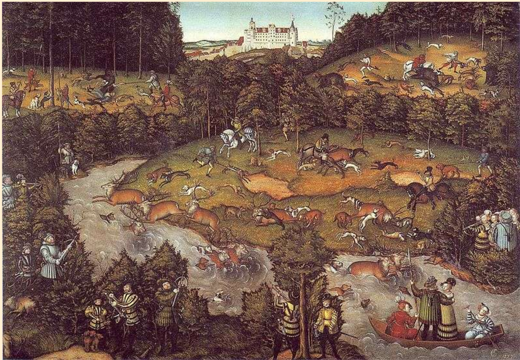
Hon na jeleny