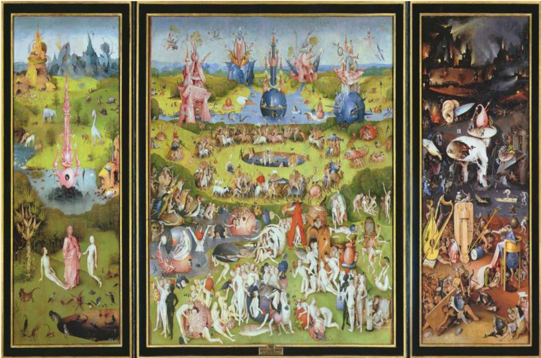
Zahrada pozemských rozkoší