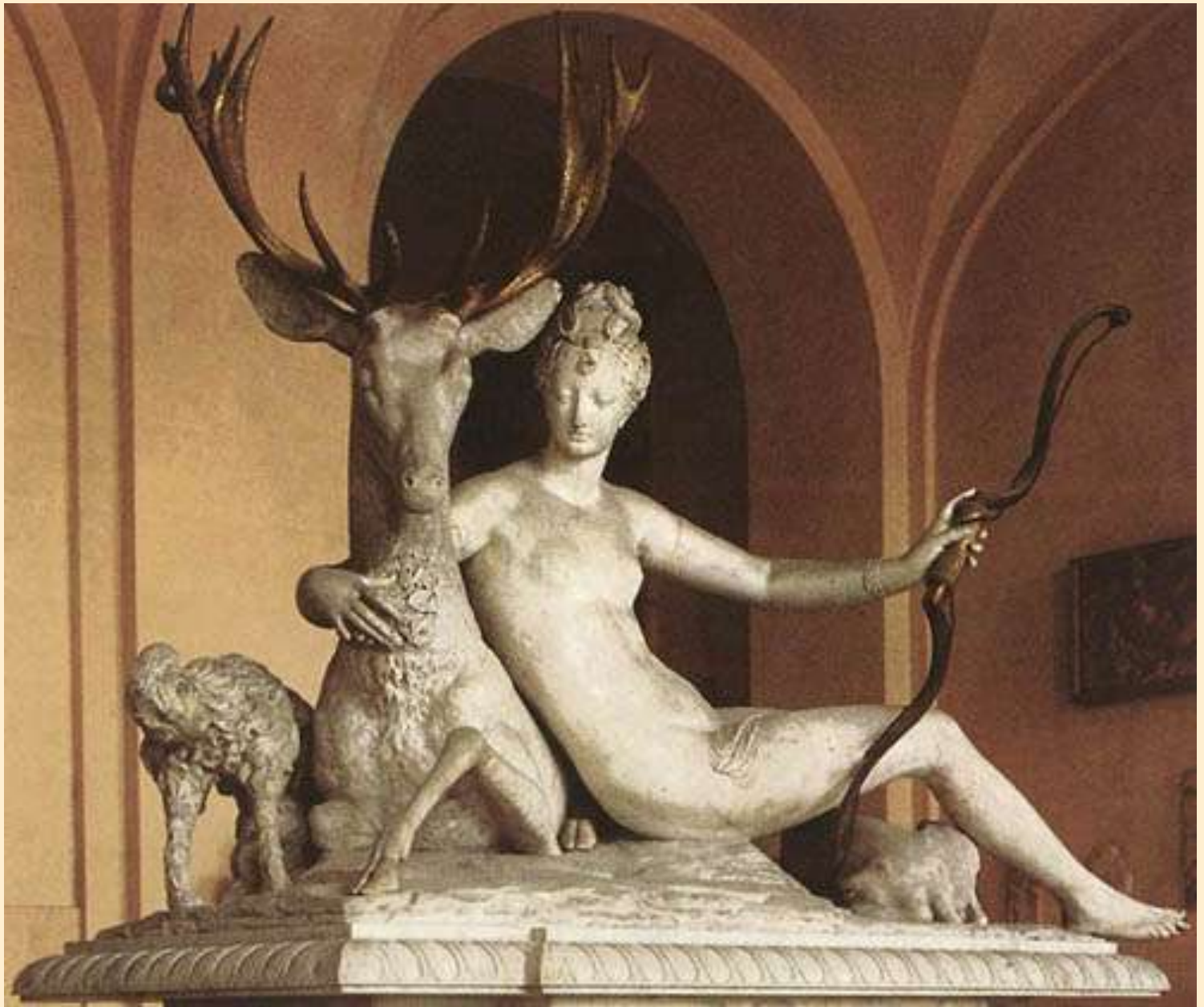
Jean Goujon – Diana a jelen