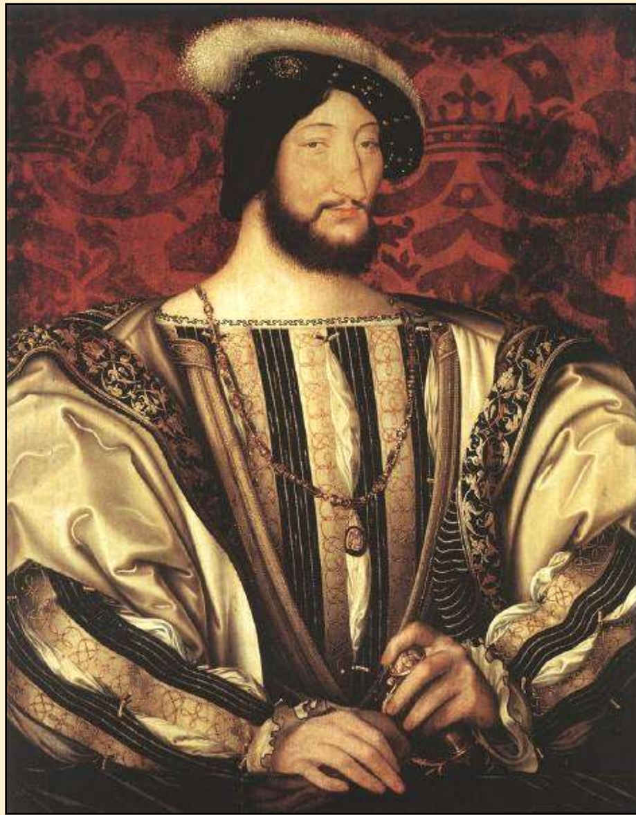
Jean Clouet – Portrét Františka I.