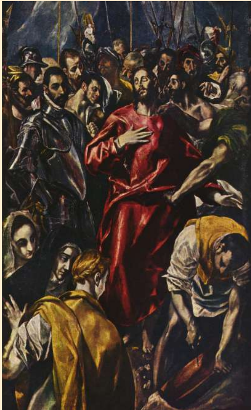
Kristus svlékán z roucha