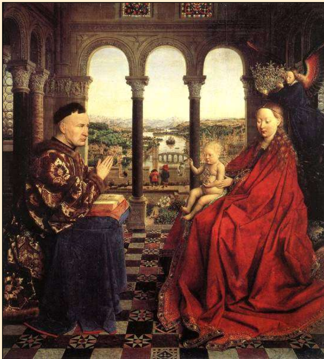
Madona kancléře Rolina