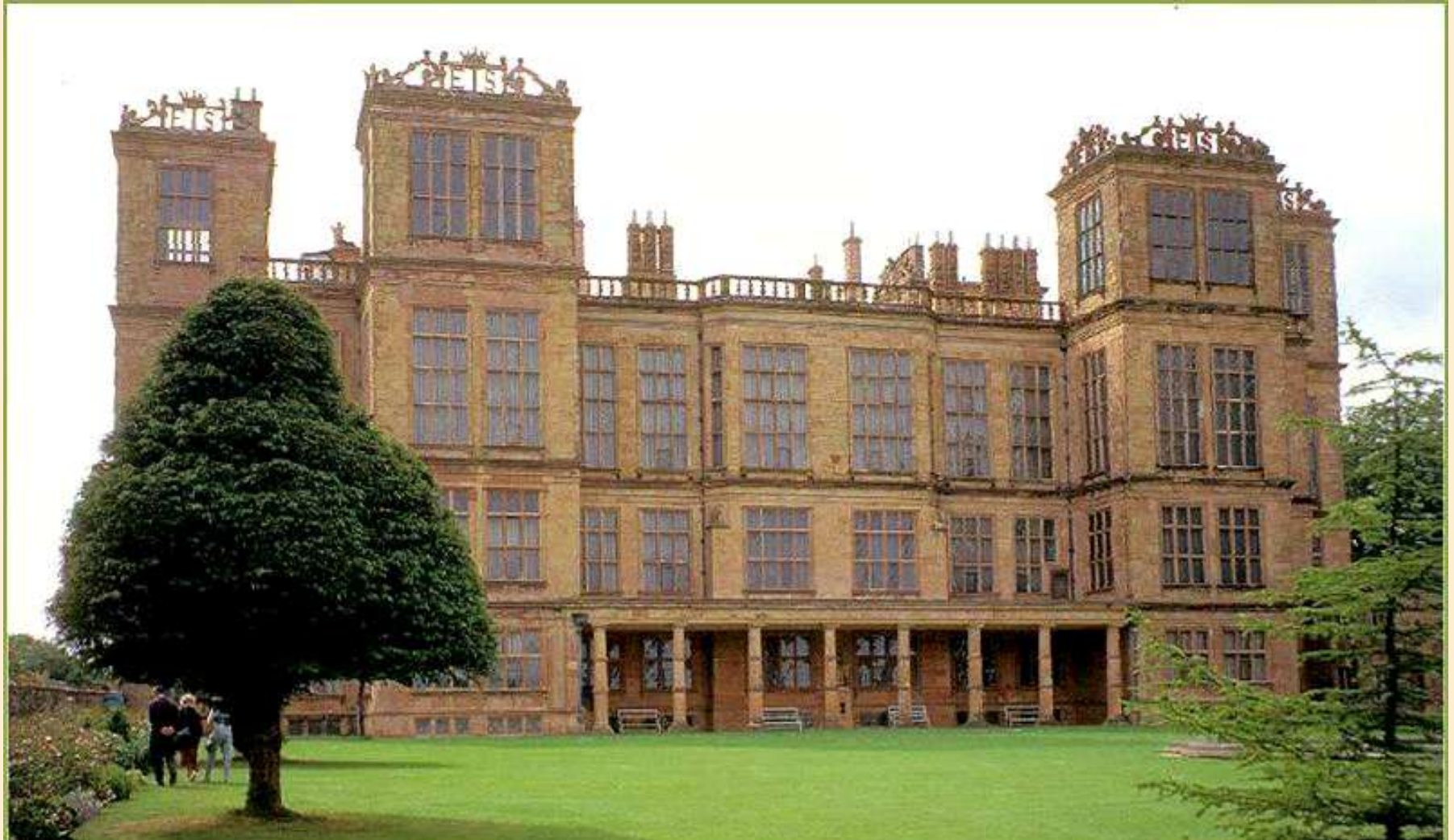
Robert Smithson - Hardwick Hall