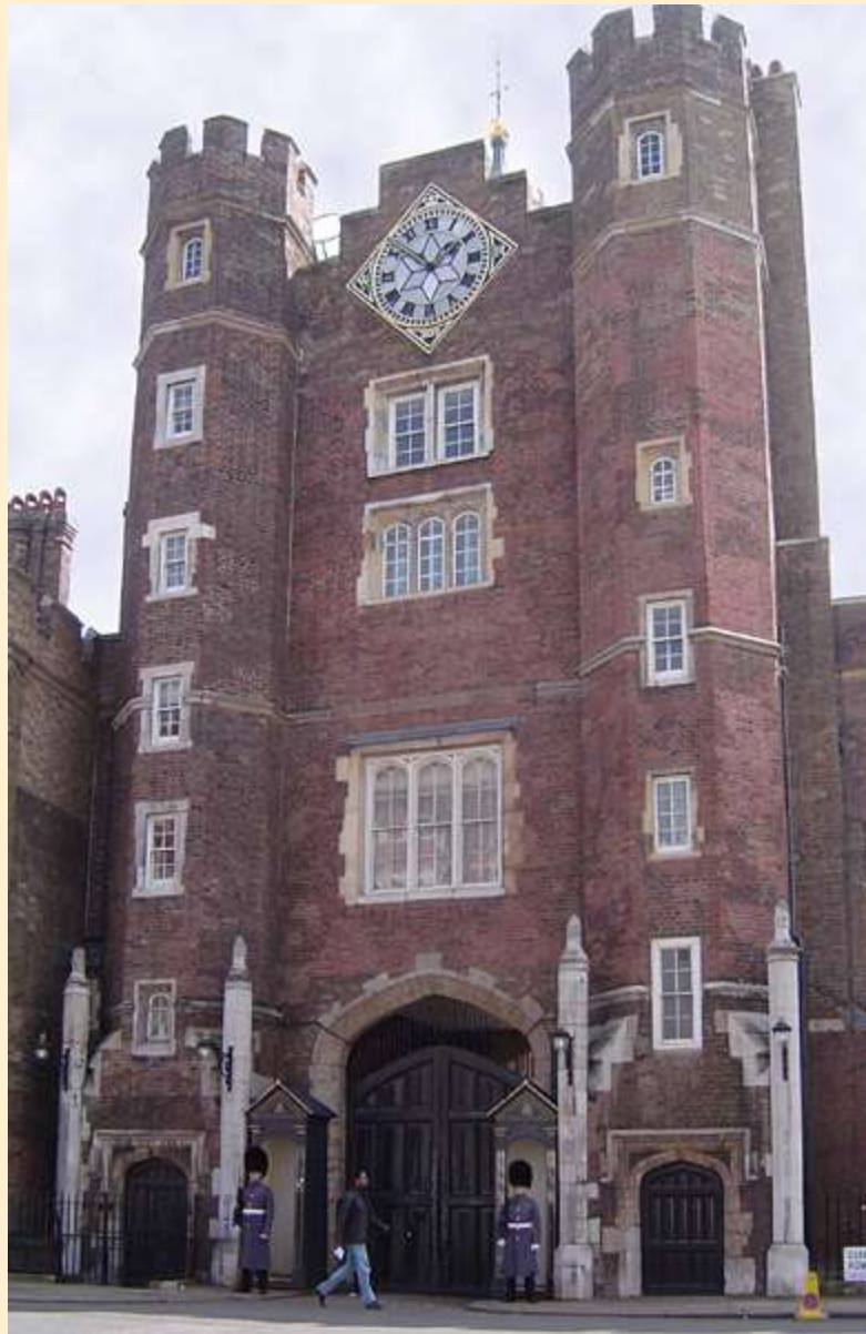
Inigo Jones – St. James's Palace