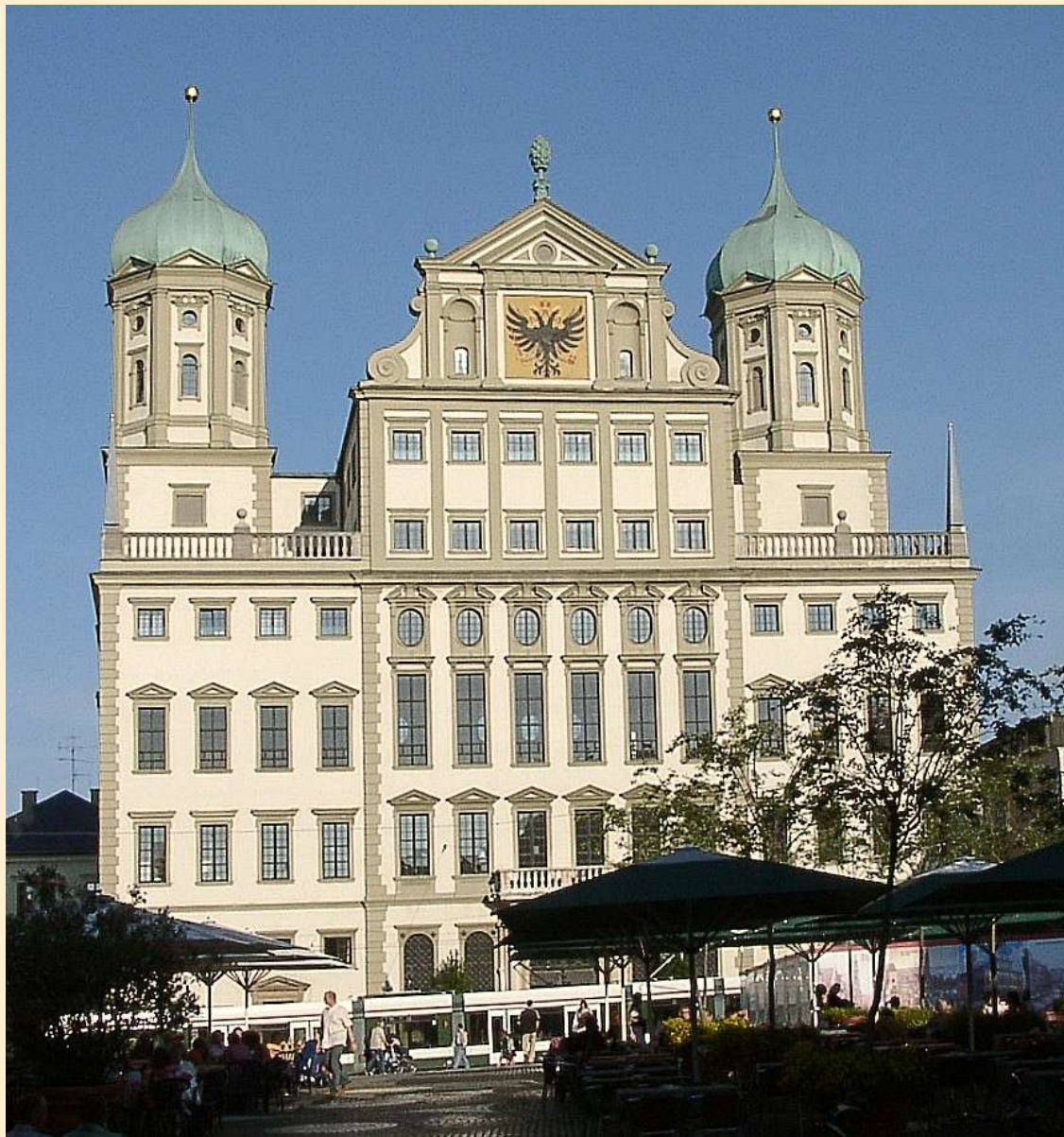
Radnice v Augsburgu