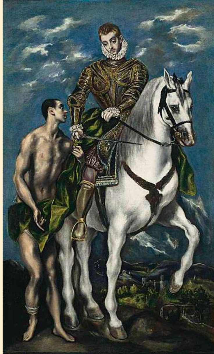
Sv. Martin a žebrák