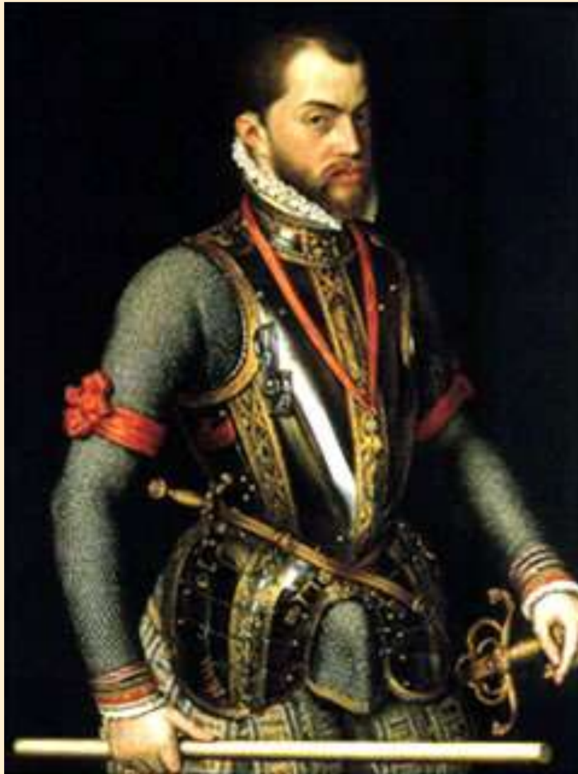
Antonio Moro – Filip II.