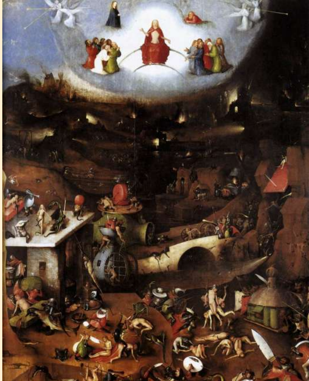
← Lod' bláznů ↑ Poslední soud