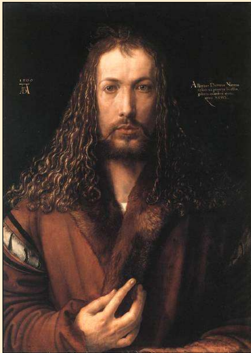
Autoportrét v kořichu (1500)