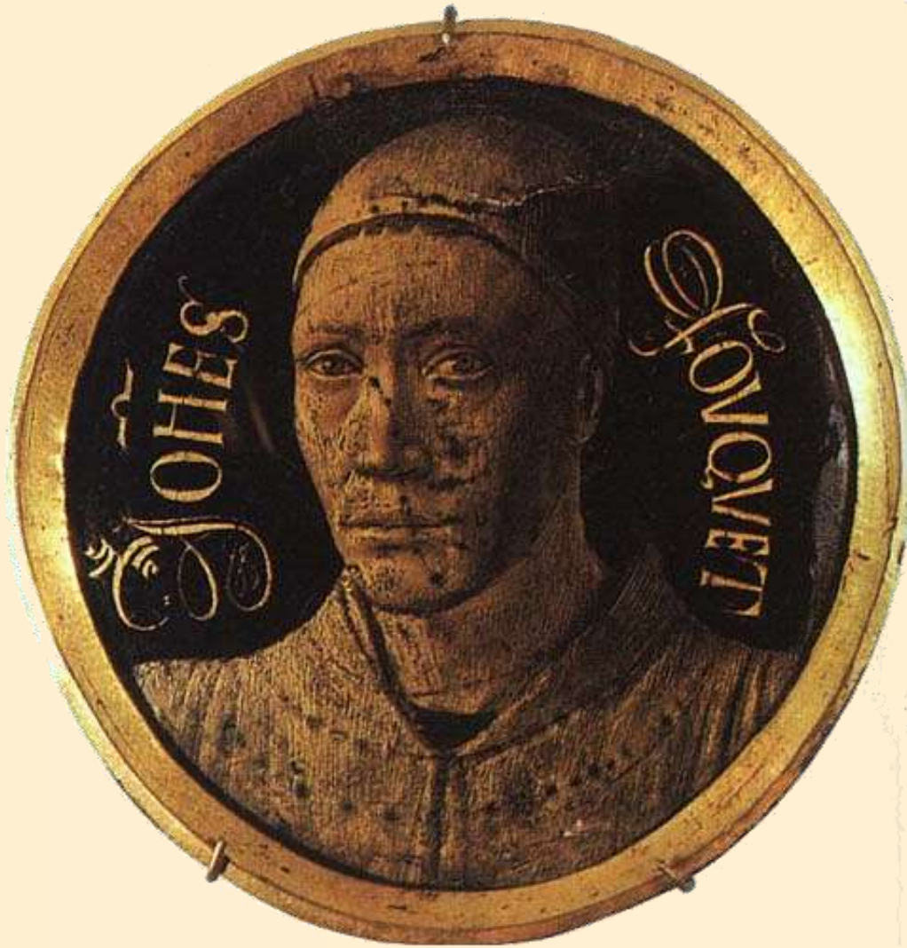
Jean Fouquet - Autoportrét